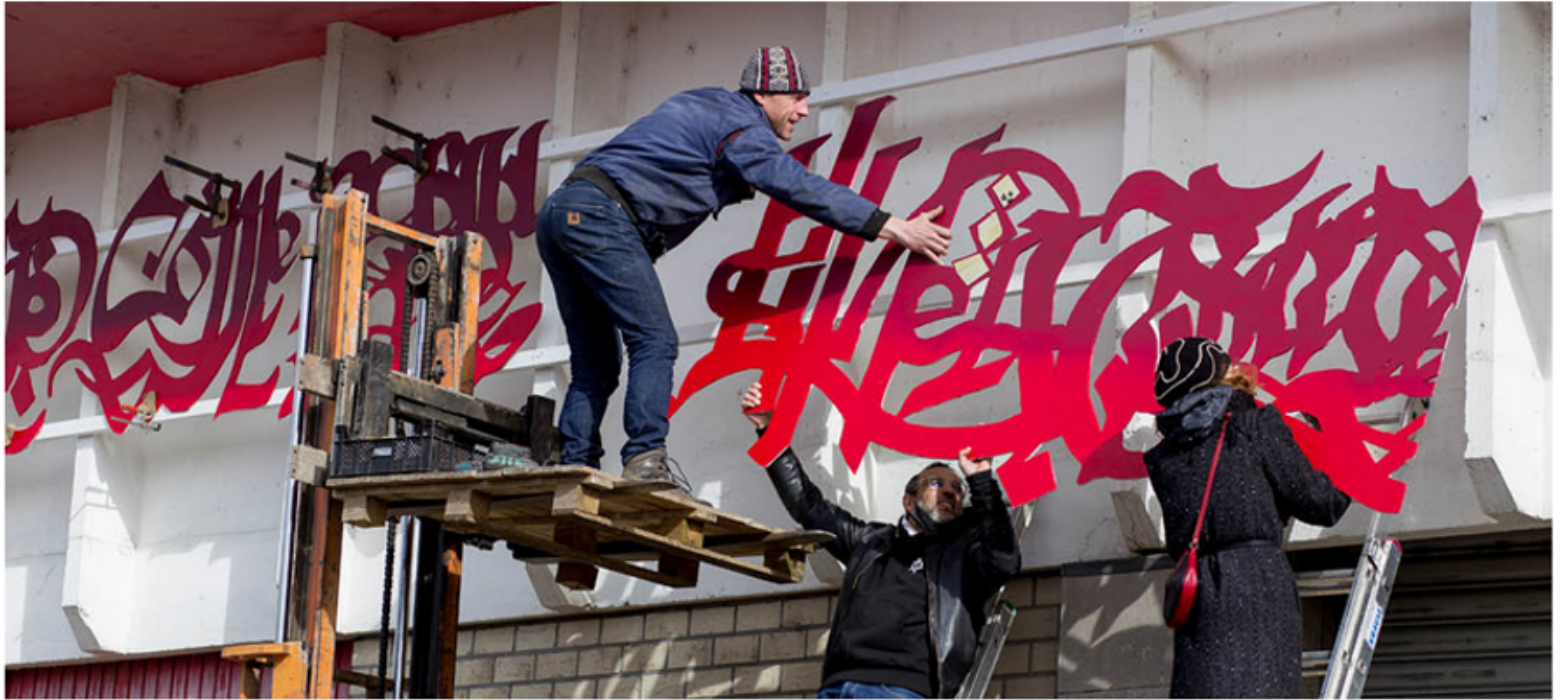
Archipel vzw © De Connectie & Sint Lucas Antwerpen